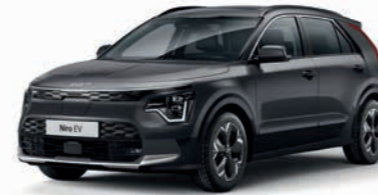
Interstellar Grau Metallic (AGT)