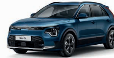
Mineralblau Metallic (M4B)