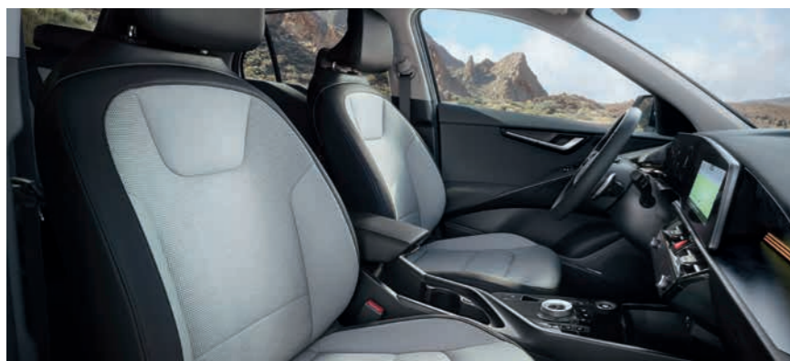
Sitzbezüge in hochwertiger Ledernachbildung, Bright (GYT) (optional)

Abbildungen zeigen kostenpflichtige Sonderausstattung.