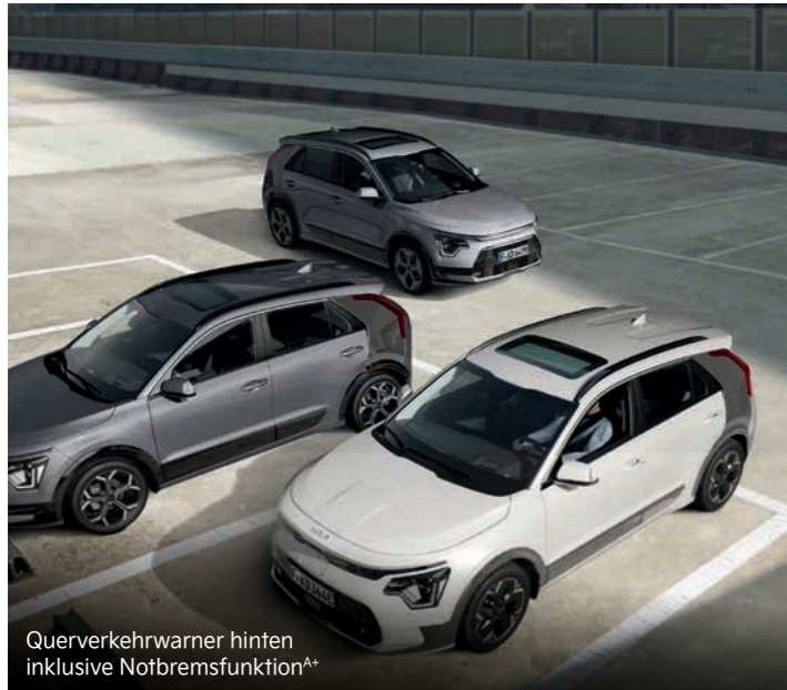
Querverkehrswarner hinten inklusive Notbremsfunktion A+

Mit einem breiten Spektrum an aktiven Sicherheitssystemen A unterstützt dich der Kia Niro EV dabei, in Gefahrensituationen schnell und angemessen zu reagieren.