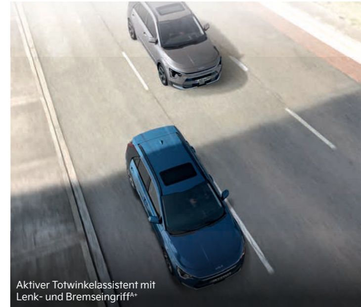
Aktiver Totwinkelassistent mit Lenk- und Bremsengriff A+

Der serienmäßige aktive Spurhalteassistent (Lane Keep Assist, LKA) behält per Kamera ständig die Fahrbahnmarkierungen im Blick. Bei einem unbeabsichtigten Verlassen der Fahrspur warnt er dich und lenkt zugleich geringfügig gegen, um das Fahrzeug in der Spur zu halten (ohne Abbildung).