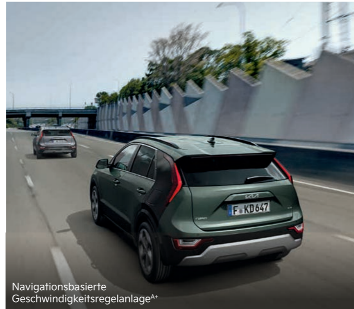
Navigationsbasierte Geschwindigkeitsregelanlage A+

Kia Niro EV: Stromverbrauch, kombiniert (kWh/100 km) 16,2 (64,8-kWh-Batterie). CO 2 -Emission, kombiniert (g/km): 0; Effizienzklasse: A+++. Kia Niro Hybrid: Kraftstoffverbrauch in l/100 km für innerorts/außerorts/kombiniert 3,8/4,5/4,2. CO 2 -Emission, kombiniert (g/km): 97; Effizienzklasse: A+.