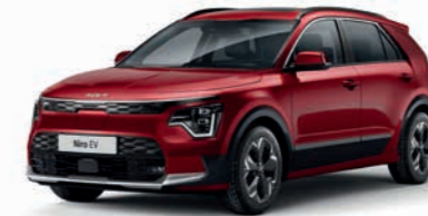
Runway Rot Metallic (CR5)

Bei einigen unserer modernen Metallicfarben werden bewusst unterschiedliche Farbpigmente verwendet. Dadurch können unter bestimmten Lichtverhältnissen, z. B. direktes Sonnenlicht, attraktive Farbeffekte erzielt werden. Zum Teil kann die Farbe changieren, z. B. von Schwarz zu Dunkelblau. Bei den hier abgebildeten Farbdarstellungen kann es aufgrund der Drucktechnik zu Abweichungen zu den Originalfarben kommen. Weitere Informationen zu den Farbeffekten und Grundfarben erhältst du bei deinem Kia-Partner. Metalliclackierungen sind aufpreispflichtig.