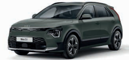
Cityscape Grün Metallic (CGE)