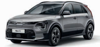
Stahlgrau Metallic (KLG)