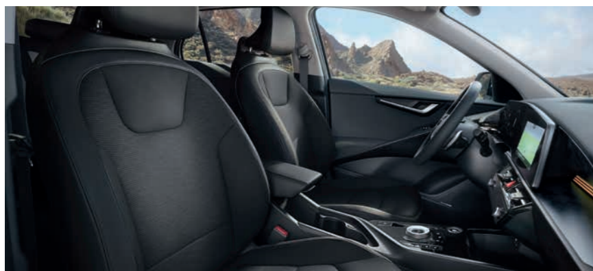
Sitzbezüge in hochwertiger Ledernachbildung, Charcoal-Grau (DFS) (optional)